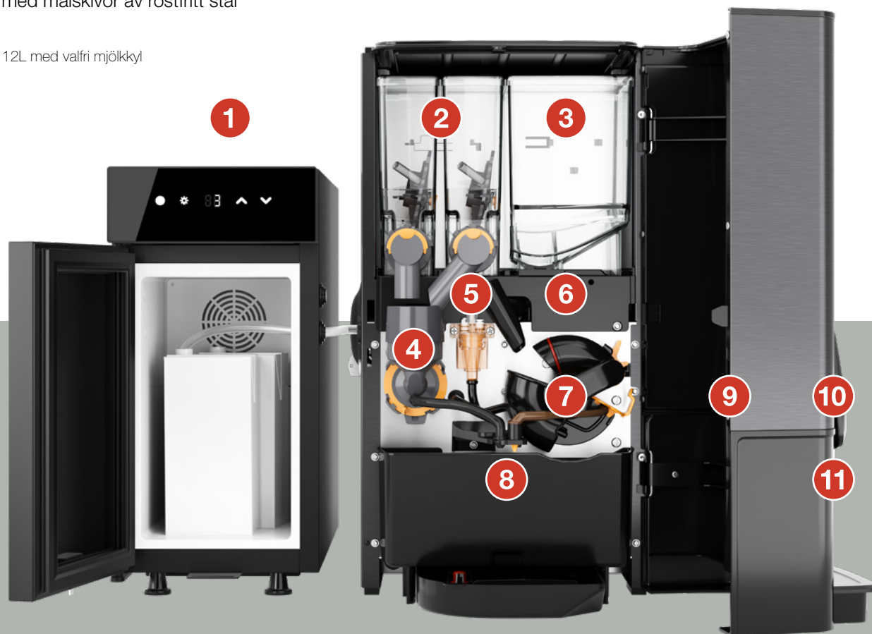
Sego 12L med valfri mjölkkyll