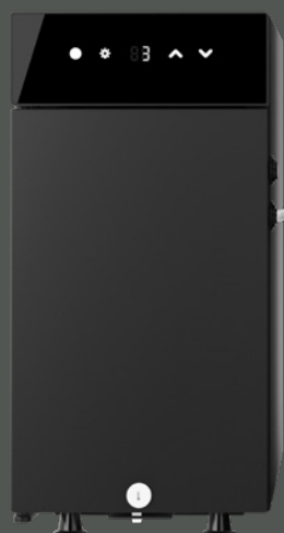
Sego L med mjölkkyll