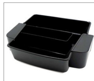
spillbricka för förhöjning