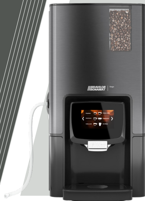
Sego L utan mjölkkyll