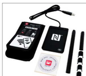
kit för Sego CCC-appen