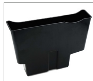
sumpbehållare för förhöjning