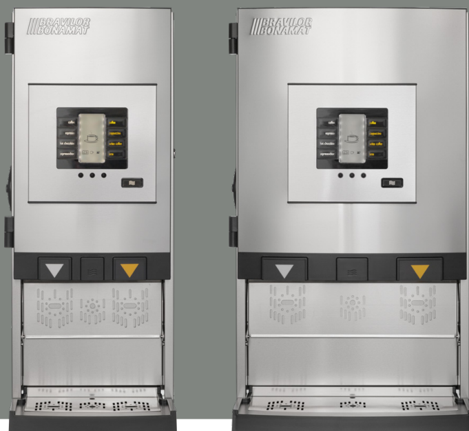
Bolero Turbo XL 403