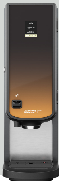
Bolero 21 med hetvattenkran