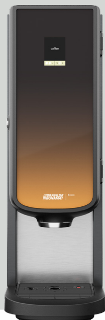
Bolero 11 utan hetvattenkran