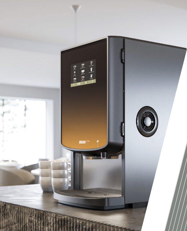
Bolero Turbo 403